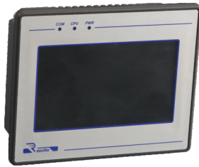
Pannello di controllo OPT4 con touch-screen e schermo da 4,3" a colori.